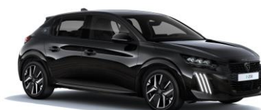
Perla Nera fekete