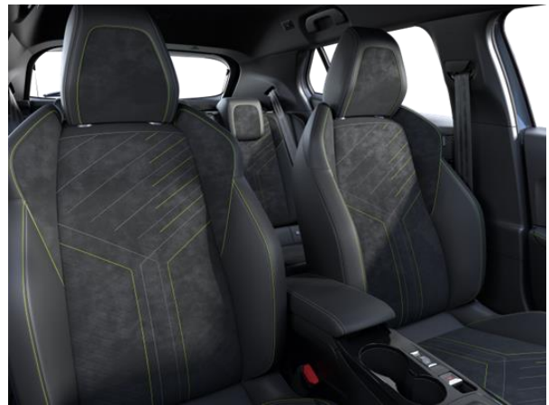
Alcantara ICONIUM kárpit 'adamite' díszvarrással GT opció